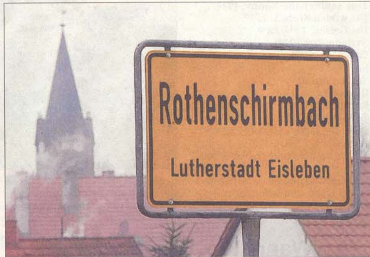
Die St.-Pancratius-Kirche im Eisleber Ortsteil Rothenschirmbach, die Autobahnkirche werden möchte, könnte von Ilek-Förderung profitieren.

Doch nach Meinung der Mitarbeiter des Eisleber Bauamtes ist das Programm von Beginn an mit Fehlern behaftet. Zum einen weist es dem Eisleber Raum, die Orientierung in Richtung Harz zu. Eine Orientierung, „die es in Eisleben nicht gibt“, so Richter. Zudem habe Eisleben im Landesentwicklungsplan bisher stets zum Ballungsraum Halle gehört, was nach Kirchners Worten durchaus sinnvoll ist. Doch nun wurden von Magdeburg aus die Zuordnungen geändert, der neue Großkreis Mansfeld-Südharz wird der Harzregion zugeschlagen. „Eine Entwicklung, die wir nicht verstehen, aber die wir hinnehmen