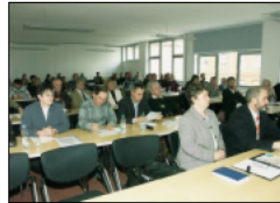
Die Teilnehmer des 2. Regionalforums zum ILEK tauschten sich in der Mammothalle in Sangerhausen aus.

die Abwanderung junger Menschen aus der Region gestoppt werden. Seit November berieten Arbeitsgruppen zu Themen wie: Nutzung regenerativer Energien, Landschaftspflege, Vermarktung regionaler Produkte, Aktivtourismus oder Bergbaufolgelandschaften. Eine zentrale Rolle spielt dabei das Zusammenwachsen beider Landkreise. Ziel des ILEK ist es, Projekte zu erarbeiten, welche die regionale Wertschöpfung erhöhen und Arbeitsplätze schaffen. Das Forum ruft alle interessierten Bürger, Vereine, Unternehmen, die konstruktive Wünsche, Vorstellungen und Ideen haben auf, sich an diesem Projekt zu beteiligen. Informationen gibt es im Internet unter www.ile-mansfeld-suedharz.de , Tel. 03475 / 208555 (während der Sprechzeit) oder 03643 / 502736. Sprechzeit des ABRA-XAS Regionalbüros, Bahnhofring 14 (TGZ) in der Lutherstadt Eisleben ist donnerstags von 14.00 – 18.00 Uhr.