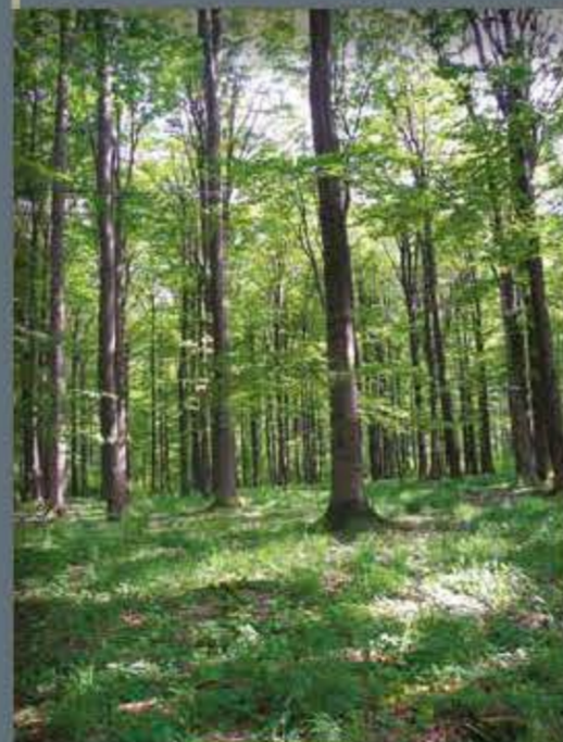
Selketal und Bergwiesen bei Stiege