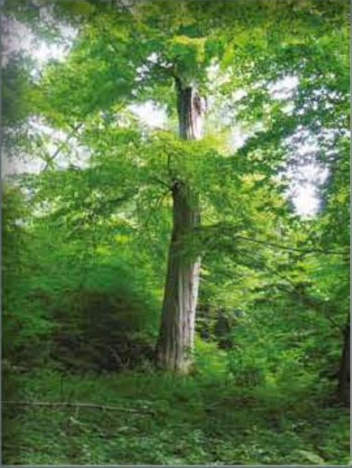
Fallsteingebiet nördlich Osterwieck