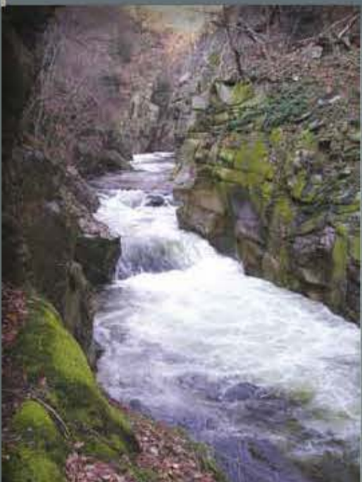
Bode und Selke im Harzvorland