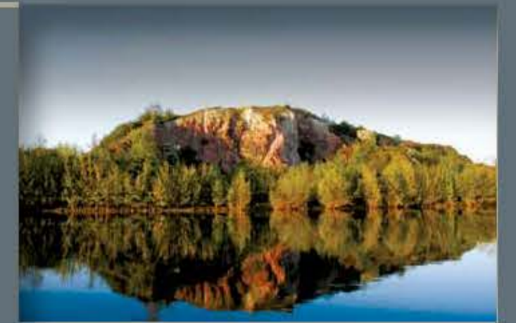
Porphyrkuppenlandschaft nordwestlich Halle