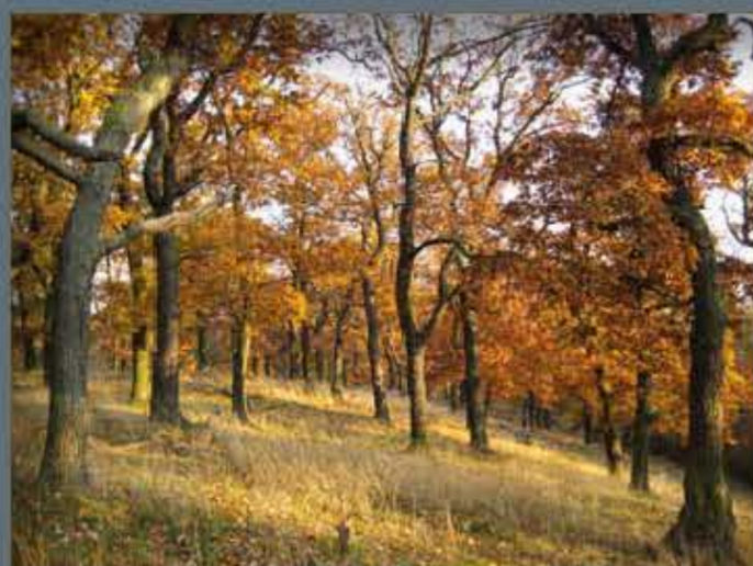
Burgesroth und Laubwälder bei Ballenstedt