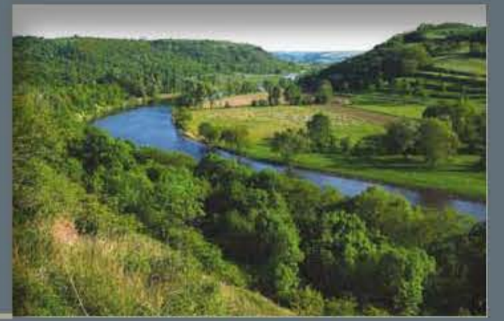
Saaledurchbruch bei Rothenburg