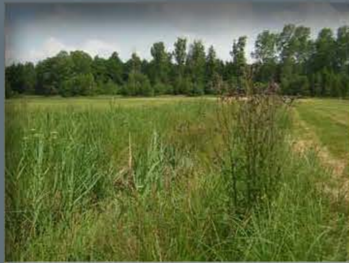
Der Most bei Harpe